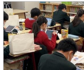
【ワークに取り組む様子】