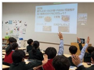
【クイズで楽しみながら学習】