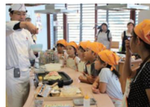
過去のお好み焼教室の様子 写真上) Wood Egg お好み焼館会場 写真下) オタフク東京本部ビル会場