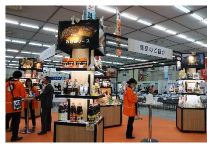
活力フェアの様子 (2019年 広島会場)